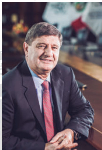
Raúl Diez Canseco Terry Ex Vicepresidente del Perú Fundador Presidente Universidad San Ignacio de Loyola

“Este reconocimiento nos compromete a continuar por la senda de la excelencia académica a nivel internacional y a seguir apostando por una educación de calidad en el Perú”.